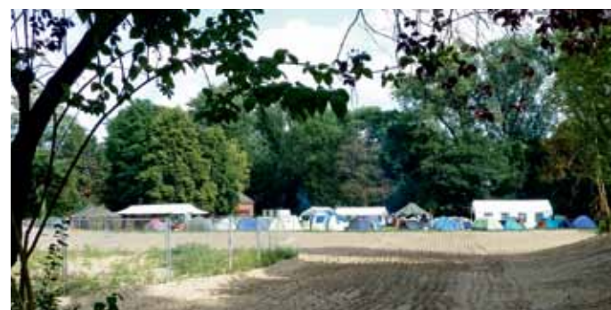
De lege plek hier in gebruik als tentenkamp tijdens de introductiedagen.

Meer informatie en voorwaarden zie www.legeplek.nl