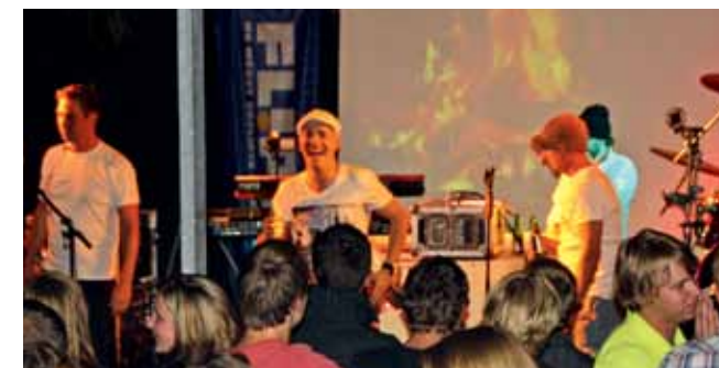
De band "Flippen" als swingende afsluiting van Laarpop 2012.

De VVA maakt nog bekend hoe je je kunt aanmelden voor de eenvoudige doch voedzame maaltijd. Deze maaltijd is niet geheel kosteloos, de rest van het programma is wel gratis.